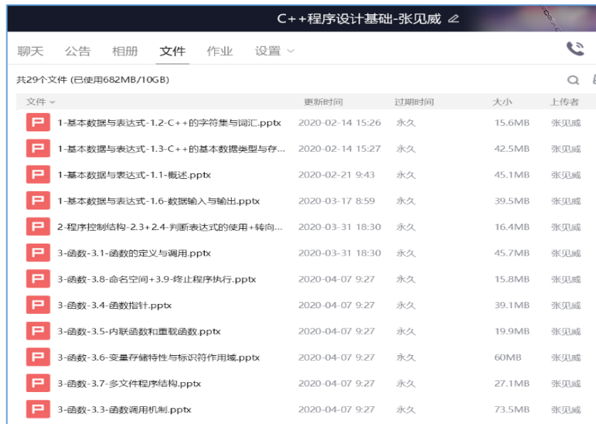
图4 QQ群中带语音的PPT文件(本人录制) (文件过大的不是永久文件, 没在列表中, 学生已及时下载)