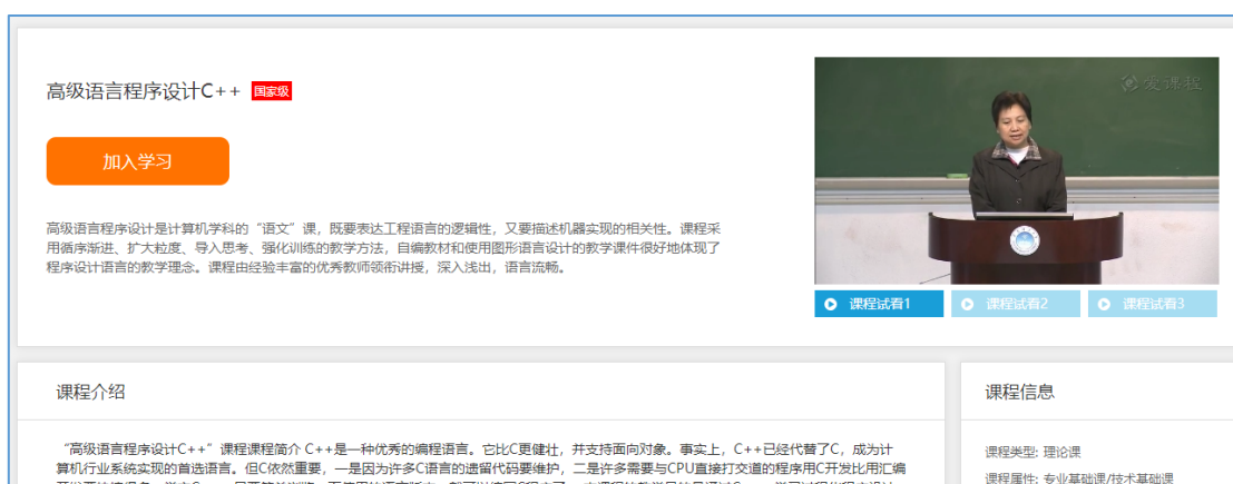
图 2 爱课程上的资源共享课页面 (省精品资源共享课和国家精品资源共享课)

http://www.icourses.cn/web/sword/portal/shareDetails?cId=5847#/course/chapter