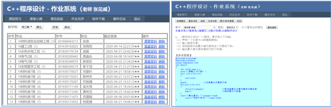
图3 自主研发的作业系统 (华南理工大学计算机公共基础教学团队朱延钊老师研发)